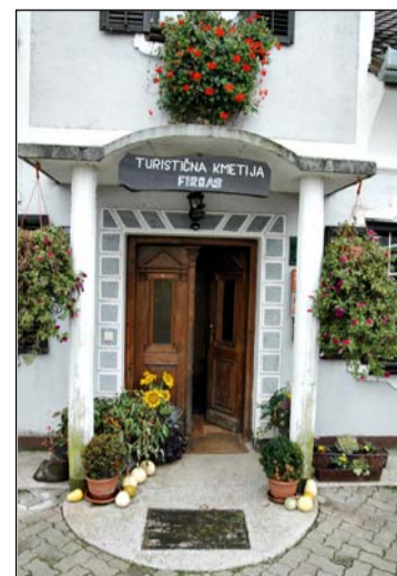
INNBYDENDE: Blomster og dekorasjoner bilser velkommen til gards i slovensk bygdeturisme.

ZTKS ble dannet i 1997 og har ifølge de siste tall 322 medlemmer (litt mindre enn Hanen, som ligger mellom 400 og 500). Organisasjonen jobber både for å bedre belegget hos medlemmene og for høyere kvalitet i bransjen. Den har også som uttalt mål å opprettholde arbeidsplassene på slovenske gardsbruk og bekjenner seg til verdier som bevaring av bosetting og kulturarv på bygda. Et strategidokument fastslår at organisasjonen skal «bidra til at landsbygda framstår med en