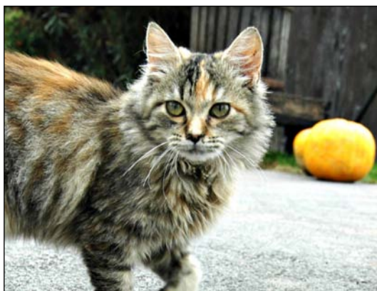
TREKKPLASTER: En viktig medarbeider på Firbas-garden. Smådyr er en magnet på barnefamilier.