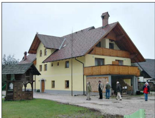
MYE NYTT: Nybygd bus med overnattingsrom på turistgard nær Bled.